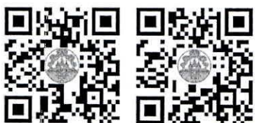
กำหนดการ แบบตอบรับ

ช่วยทำงานชั่วคราวในตำแหน่งผู้พิพากษาหัวหน้าศาลจังหวัดมุกดาหาร